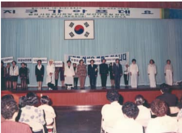
▲ 환경사진전시회 및 환경살리기 초청 강연회_1994.10.05