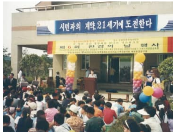
▲ 제6회 환경의 날 행사_2001.06.02

1992년 6월 창립 이후 서귀포YWCA는 지역사회 환경의식 확산을 위해 꾸준한 활동을 이어왔다.